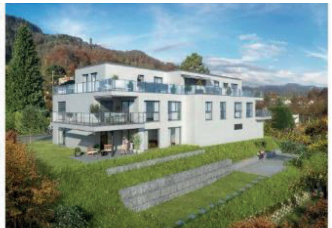
2017 - Sonnenberg 41, Adliswil 4 Whg.