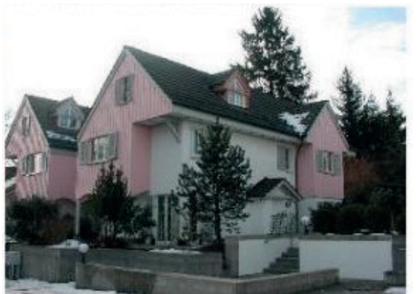
4 EFH Thalwil Aubrigstrasse