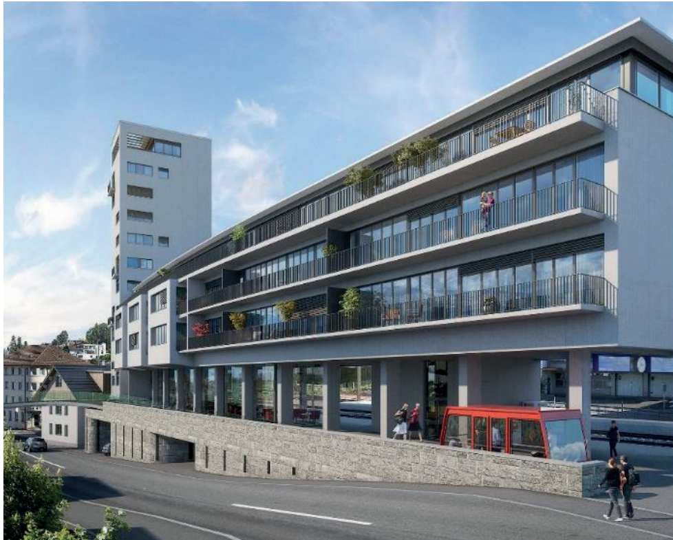
Aktuell: Horgen-Oberdorf Projekt SAHO mit 22 Wohnungen nach Kostenmiete - Modell von Architekt Aaron J. Wegmann, Dipl. Arch. M. Arch. SIA, Rüschlikon. Im Co-Work mit Consularia GmbH Zollikon.