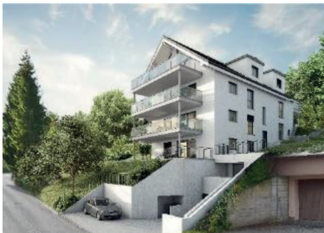
2018 - Kirchboden 77, Thalwil 7 Whg.

Als Bauherrenvertreter und Verkäufer realisierte Wohnbau-Projekte am linken Zürichsee-Ufer für Stockwerkeigentum in Thalwil und Rüschlikon: