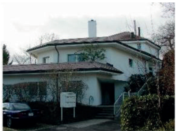
Terrassenh. Thalwil Fink