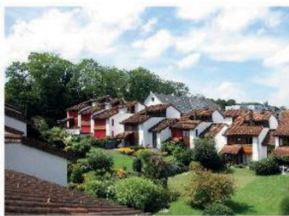
REFH Thalwil Marbach