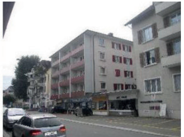
MFH Thalwil Gotthardstrasse