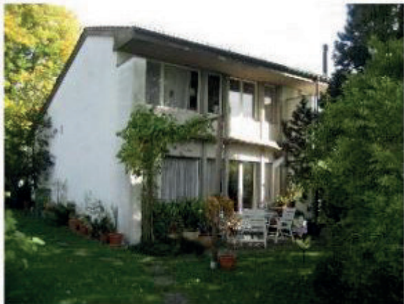
REFH Thalwil Etzliberg