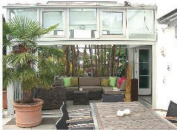
EFH Thalwil Säumerstrasse