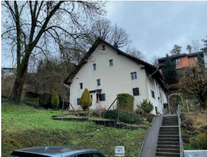
Birmensdorf ZH Risirainweg 22 EFH