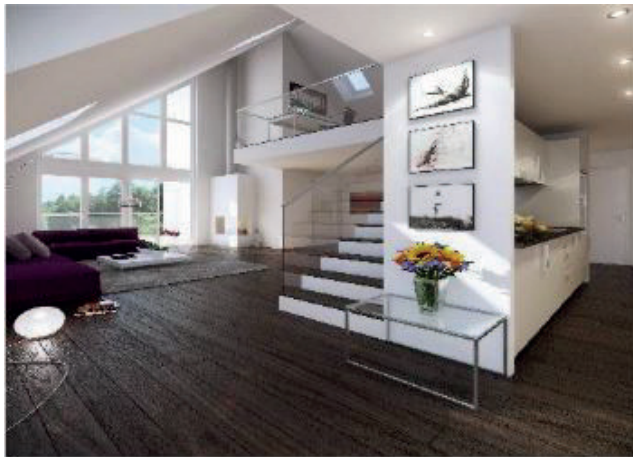
2012 Rüschlikon «Im Rührets» 7 Whg.