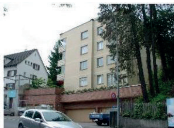
MFH Thalwil Gotthardstrasse