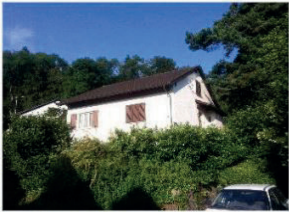
EFH Lärchenstrasse 5