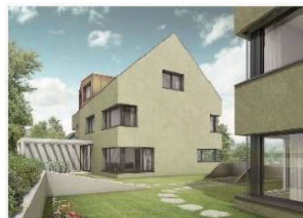
4 DEFH Thalwil Aegertli