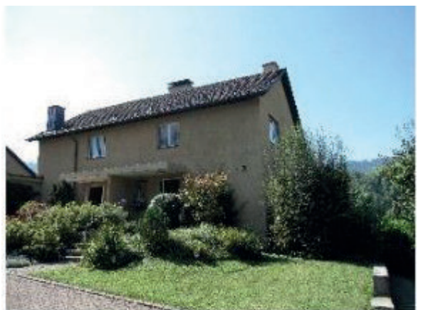
EFH Gattikon Waldstrasse