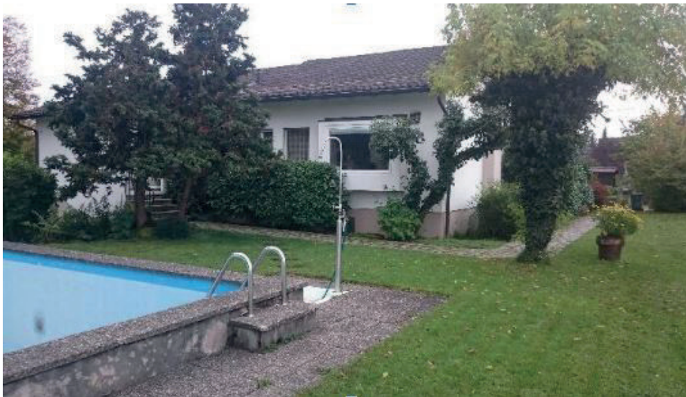
Grüningen Brunnenwies 6 Erbgem