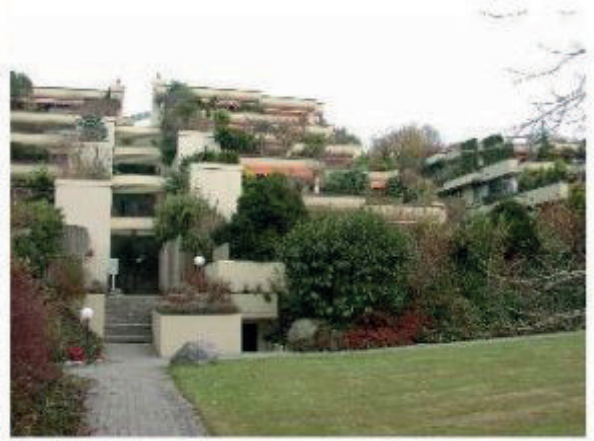
4 Terrassenh. Kennelstr.