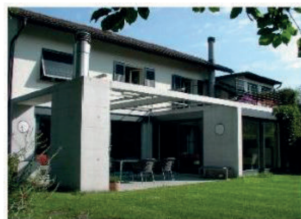
EFH Thalwil Alsenmatt 11