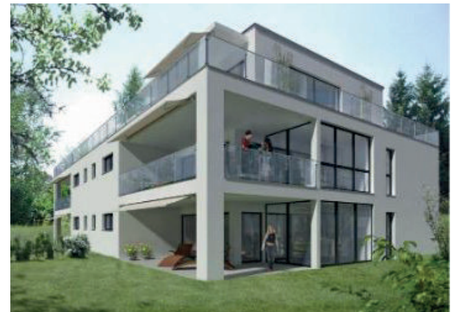
2020 - 4-Fam.Haus Neubau in Birmensdorf (StwE)