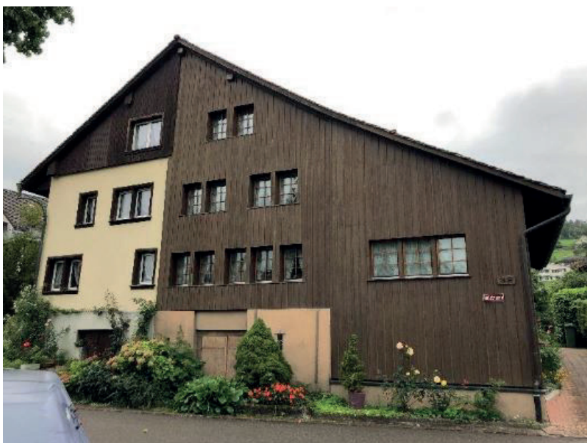
Oberrieden EFH für Erbgemeinschaft