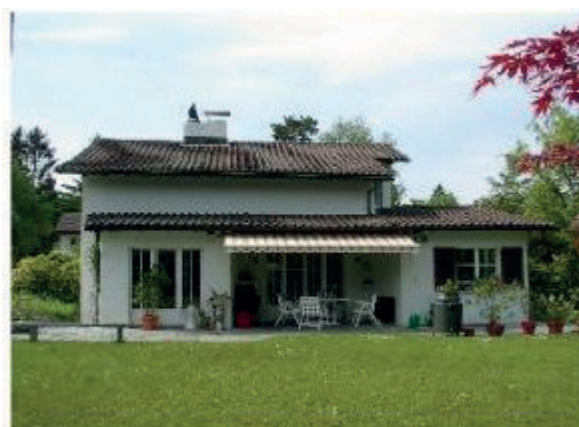
EFH Thalwil Alsenmatt 7