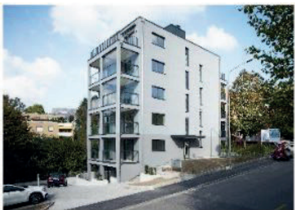
6 StwE Gattikon