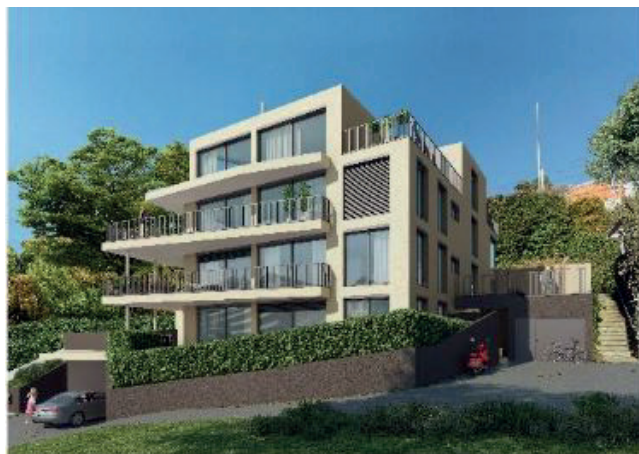
2020 - 4-Fam.Haus Neubau in Birmensdorf (StwE)