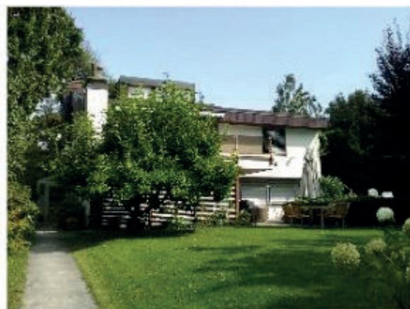
Villa Thalwil In der Rüti