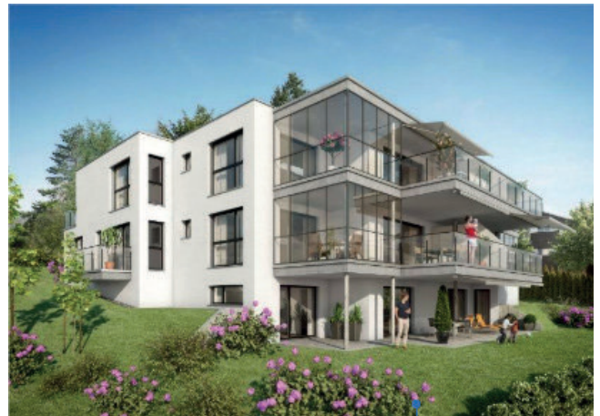
2015 Uitikon-Waldegg, Neubau 5 Whg.

uptown-thalwil.ch 14 Eigentumswohnungen in der Rüti 8800 Thalwil