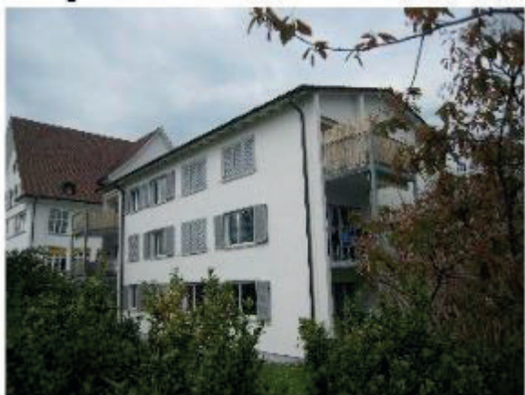
MFH Thalwil Zehntenstrasse