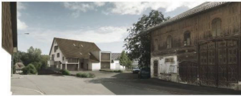
3 Familienhaus Gattikon, Sihlhaldenstrasse

Insgesamt weit über 100 Objekte / Mandate allein in der Region Zürichsee - Zimmerberg - Sihltal und der Stadt Zürich.