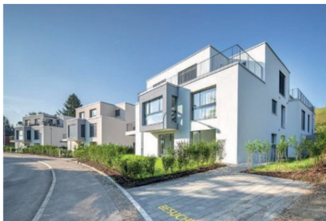
2019/20 Aesch (Maur) StwE 8 Wohnungen

Generalunternehmung: continium Baumanagement AG CH- 8810 Horgen